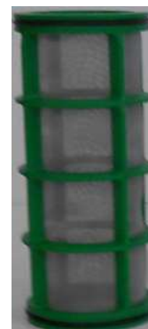
Tamis inox 200 µm surface: 270 cm 2

Les 2 tamis sont toujours livrés, le choix se fera après essais