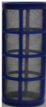
Tamis inox 500 µm surface: 270 cm 2

Bouchon de purge avant dévissage et ouverture du capot